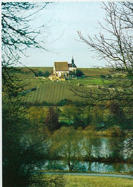
Weinberge bei Volkach